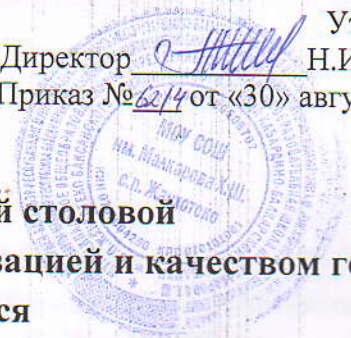
График посещения школьной столовой комиссией (родительский контроль) за организацией и качеством горячего питания обучающихся