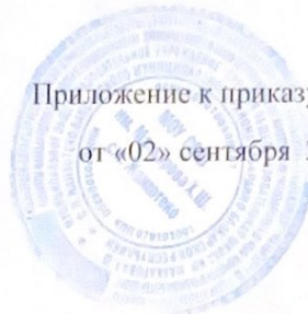
График закладки продуктов в котел

Приложение к приказу № 120 от «02» сентября 2024г.